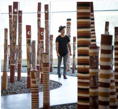
National Gallery of Australia